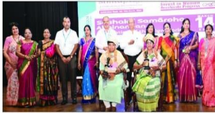
ವಿಶ್ವವಿದ್ಯಾಲಯದ ಅಧ್ಯಯನ ಶಾ.ವಿ.ವಿ.ವಿ. ಅಲ್ಪಲ್ಪ ಕಲಾಂ ಪ್ರೇಕ್ಷಣ್ಯದಲ್ಲಿ ಗುರುವಾರ ವಿಶ್ವವಿದ್ಯಾಲಯದ ಮಹಿಳಾ ಘಟಕದ ಸಹೋದರರೊಂದಿಗೆ ಅಂತರಾಷ್ಟ್ರೀಯ ಮಹಿಳಾ ದಿನಾಚರಣೆ ಪ್ರಯುಕ್ತ ಸ್ಥಿತಿಪ್ರಜ್ಞೆ ಸಶಕ್ತಿ ಸಮಾರೋಪ ಕಾರ್ಯಕ್ರಮದಲ್ಲಿ ಮಾತನಾಡಿದ ಅವರು, ಸಮಾಜದ ವಿಸ್ತರಣೆ ಒಳ್ಳೆಯ ಮನಸ್ಸಿನಿಂದ ಬೇಕು. ಒಂದು ಸಂಸ್ಕೃತಿಯನ್ನು ಅಳವಡಿಸಲು ಪ್ರತಿಬಂಧಕವಾಗಿ ಕೆಲಸ ಮಾಡುವ ಮನಸ್ಸಿನಿಂದ, ಒಳ್ಳೆಯ ಕೆಲಸಕ್ಕೂ ಹಾಗೂ ಅವಶ್ಯಕತೆಯಿದೆ. ಆದರೆ, ಹಣಕಾಸು ಆ ಕೆಲಸಗಳು ನಿಲ್ಲಲಾರವೆಂದು ಎಂದರು.

40 ವರ್ಷಗಳ ಹಿಂದೆ ಉನ್ನತ ಶಿಕ್ಷಣಕ್ಕೆ ಪ್ರವೇಶ ಪಡೆಯಲು ಹಿಂಜರಿಯುತ್ತಿದ್ದ ಮಹಿಳೆ ಎಂದು ಸಮಾಜದ ಎಲ್ಲ ರಂಗಗಳಲ್ಲಿಯೂ ಪ್ರಧಾನ ಪಾತ್ರ ವಹಿಸಿದ್ದಾಳೆ. ನೀಲಿಮಾ ಮಿಶ್ರಾ ಇಂದಿನ ಮಹಿಳೆಯರಿಗೆ ಆದರ್ಶಪ್ರಾಯವಾಗಿದ್ದಾರೆ ಎಂದು ತಿಳಿಸಿದರು.